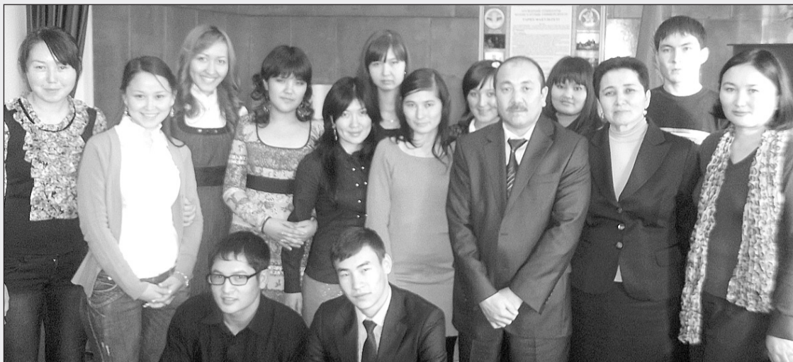
Қоғам бойындағы барлық күш-қуатты бойына жинақтайтын күш бұл – жастар. Мемлекеттің қуатын арттырып, азаматтық қоғам қалыптастыру үшін, қоғамдағы болып жатқан құбылысқа, жастардың түсіністікпен қарауы аса қажет. Сондықтан да, жастар тәрбиесін ішкі саясаттың негізгі бағыттарының бірі ретінде қарап, үнемі назарда ұстау жөн.